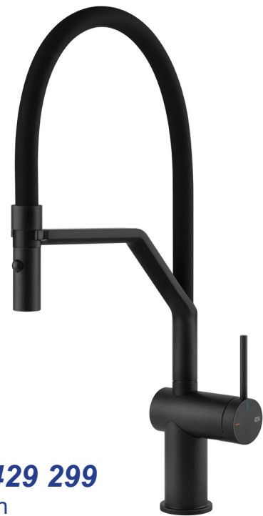
Gessi 60429 299 mit Schlauch