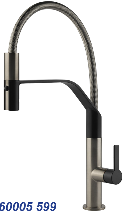
Gessi 60005 599 mit Schlauch