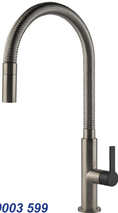
Gessi 60003 599 mit Ausziehschlauch