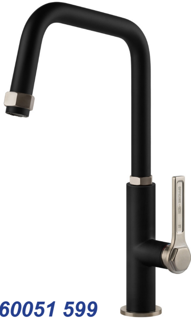
Gessi 60051 599