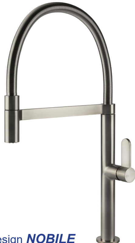
Design NOBILE mit Flexschlauch