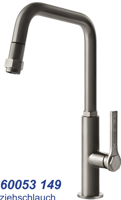
Gessi 60053 149 mit Ausziehschlauch