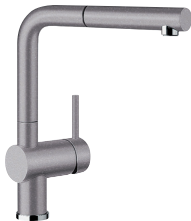
Beispiel: Linus-S Alumentallic