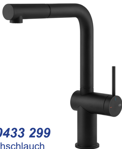
Gessi 60433 299 mit Ausziehschlauch