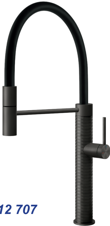
Gessi 60012 707 mit Schlauch