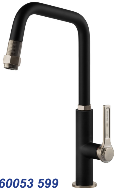
Gessi 60053 599 mit Ausziehschlauch