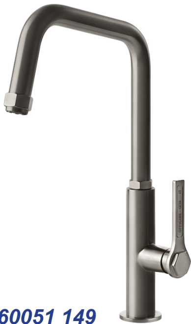
Gessi 60051 149