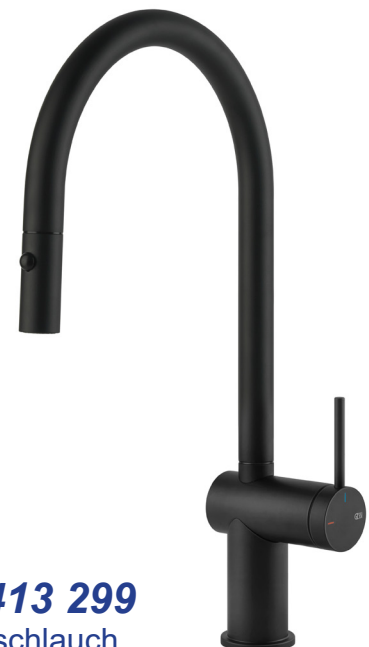
Gessi 60413 299 mit Ausziehschlauch